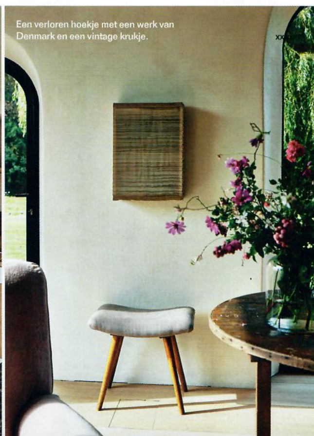
Een verloren hoekje met een werk van Denmark en een vintage krukje.