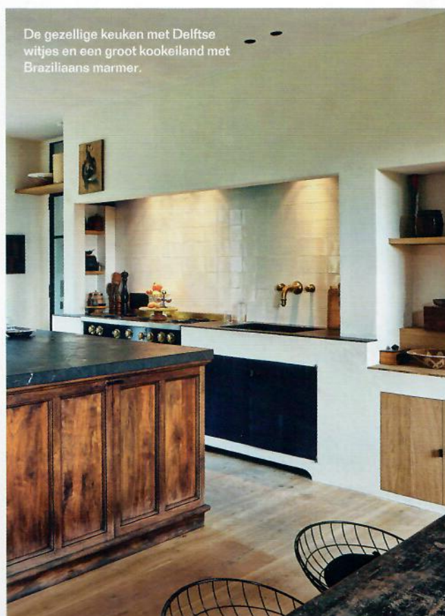
De gezellige keuken met Delftse witjes en een groot kookeiland met Braziliaans marmar.

Niet alleen de structuur is van belang, ook de lichtinval en aangewende materialen. “Ik hou van de natuurlijke en vooral artisanale materialen, zoals natuursteen, ruw hout en gekalkte muren. Zelfs een deel van de vloer werd afgewerkt met kalkbeton. De ruwe elementen maken het niet alleen landelijk, maar geven ook een hedendaagse toets die past bij het vintage meubilair. Deze materialen slijten ook mooi. Het is die mix van oud en nieuw, van antieke stukken met nieuwe creaties of vintage design die hier voor een frisse wind zorgt. Ook de contrasten tussen glad en ruw werken verfrissend en passen perfect bij deze landelijke plek waar iedereen geniet van de rust. Zo ontsnap je toch aan de tijd, niet?” •