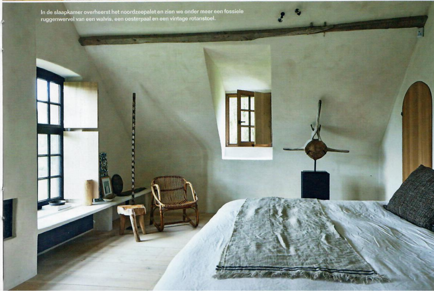
In de slaapkamer overheerst het noordzeepalet en zien we onder meer een fossiele ruggenwervel van een walvis, een oesterpaal en een vintage rotanstoel.